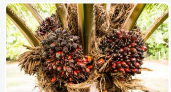
Palmier à huile

En cas de besoin d'informations, veuillez joindre le numéro suivant : +225 27 22 29 28 57 .